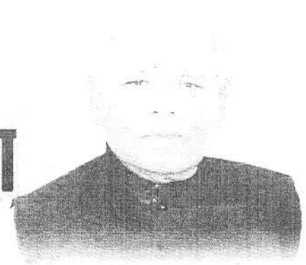
श्री जीतन राम मांझी माननीय मुख्यमंत्री बिहार